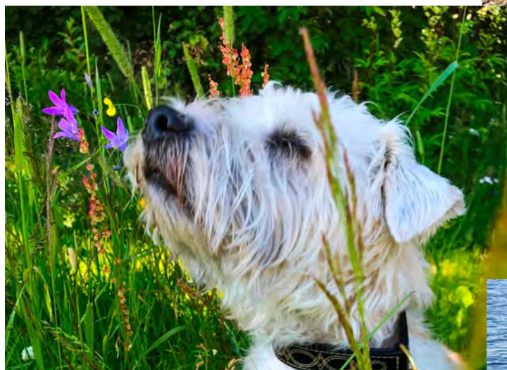
Juli månad