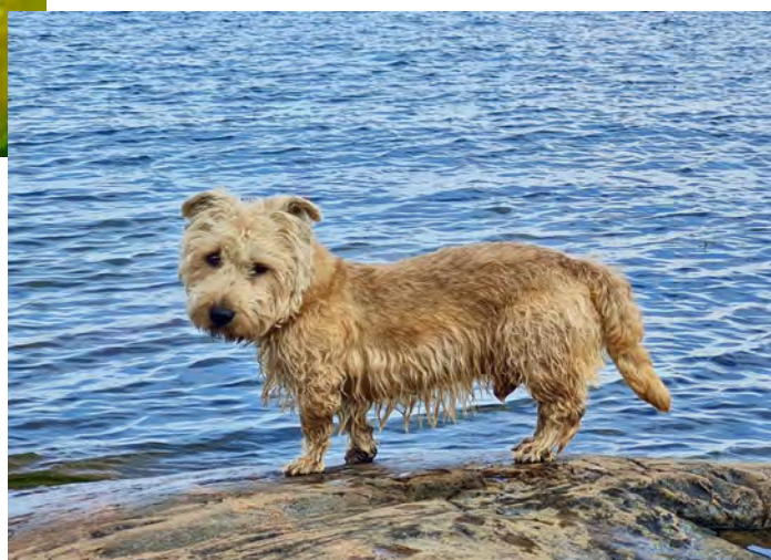
Augusti månad