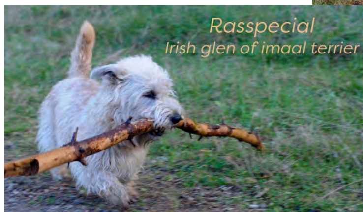
Rasspecial Irish glen of imaal terrier