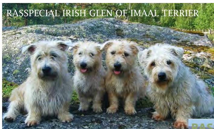
RASSPECIAL IRISH GLEN OF IMAAL TERRIER

Mycket trevligt att ägna sig åt en regnig oktobersöndag! Kanske du på kuppen får veta något nytt om vår unika ras.