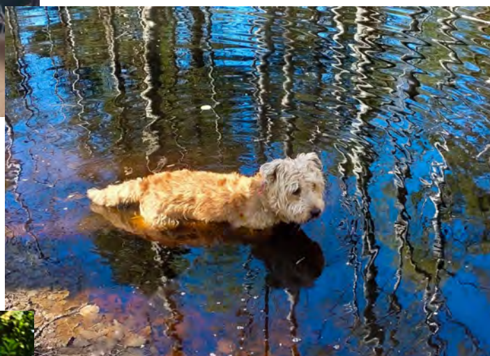
Juni månad